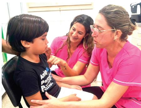
Por Ailton Silva Jornalista

“Dia D” aplica mais de 200 doses e marca início da campanha