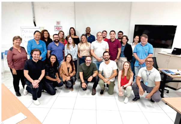
Por Ailton Silva Jornalista

Treinamento apresentou linhas de financiamento e orientou gestores sobre elaboração de projetos